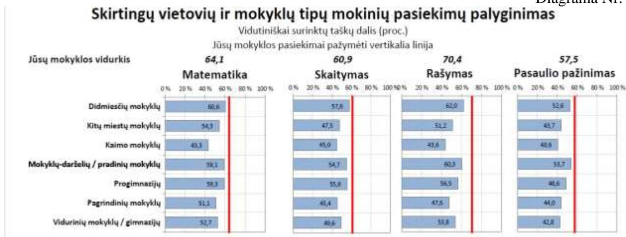
Diagrama Nr. 2

4 klasės mokinių visų dalykų standartizuotų testų rezultatai siekia nuo 57,5 proc. iki 70,4 proc. Ketvirtokams geriausiai sekėsi kurti tekstą ir atlikti matematinės užduotis. Teksto suvokimo ir pasaulio pažinimo užduočių surinktų taškų procentas žemesnis. Lyginant tų pačių mokinių 2 klasės mokymosi pasiekimų diagnostinių testų rezultatus, šiemet jie mažesni: matematikos – ↓20 proc.; teksto kūrimo – ↓19,5 proc.; skaitymo – ↓7,6 proc.