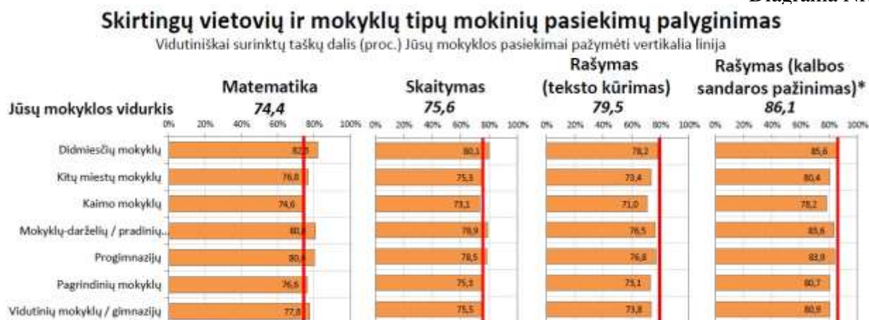
Diagrama Nr. 1

2 klasės mokinių visų dalykų vertinimo rezultatai siekia nuo 74,4 proc. iki 86,1 proc. Geriausiai mokiniams sekėsi Kalbos sandaros pažinimo ir Teksto kūrimo užduotys. Sudėtingiau buvo atlikti matematikos ir skaitymo užduotys.