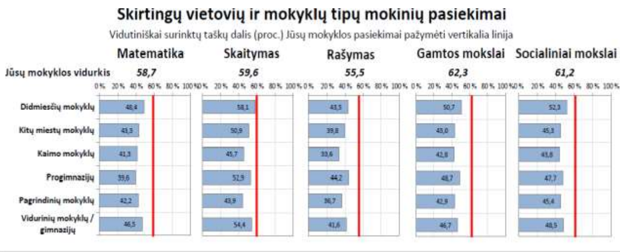
Diagrama Nr. 4