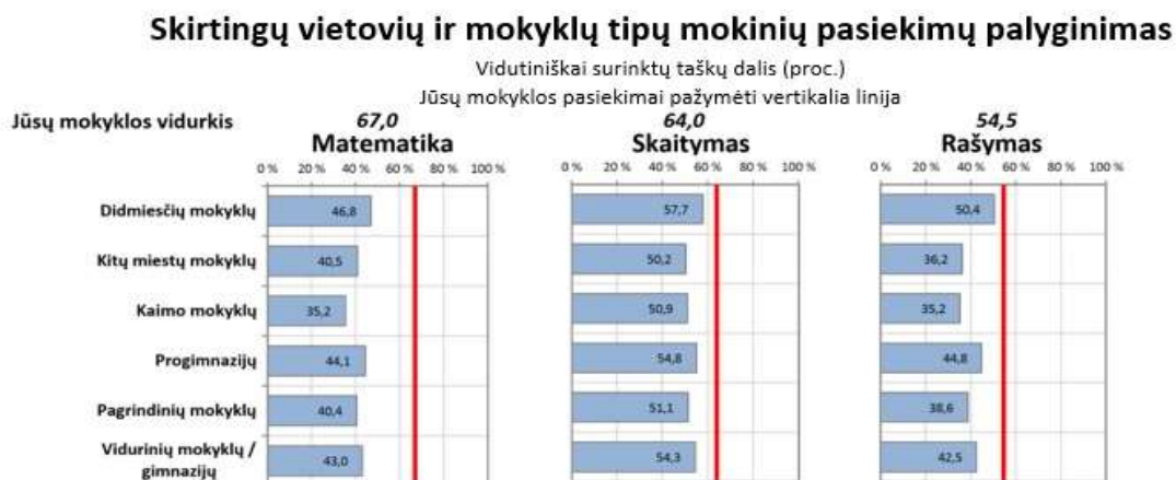
Diagrama Nr. 3